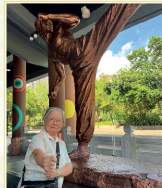
追尋李小龍的痕跡-沙田文化博物館