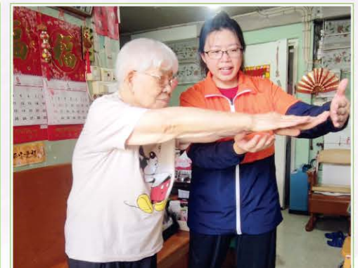
專業人員復康運動