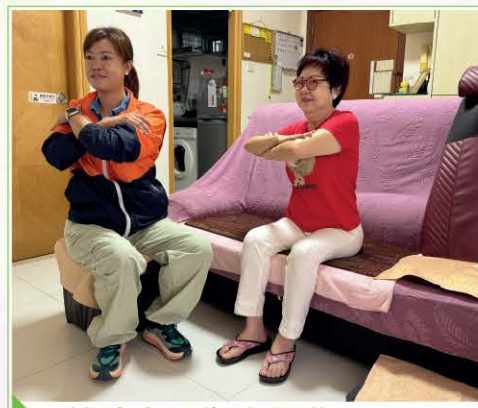
輔助人員復康運動