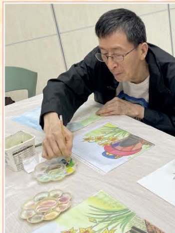
創藝同行水墨畫班