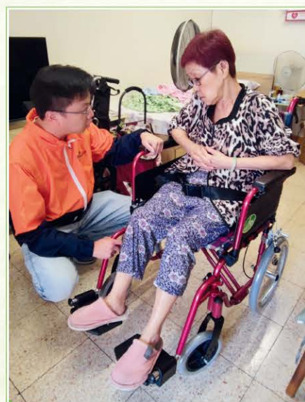
家居環境安全評估