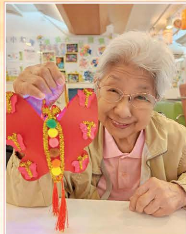
中秋燈籠工作坊小組